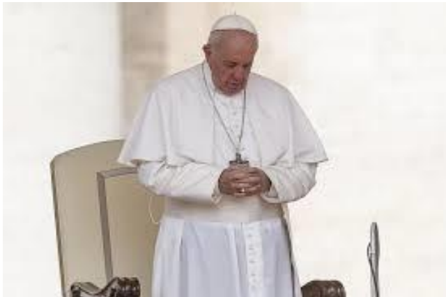
CNS translation of the prayer Pope Francis recited by video March 11 asking Mary to protect Italy and the world during the coronavirus pandemic. SPIRITUAL

Bajo tu protección, buscamos refugio, Santa Madre de Dios. No desprecies nuestras súplicas durante las dificultades, sino líbranos de todo peligro, Oh gloriosa y bendita Virgen.